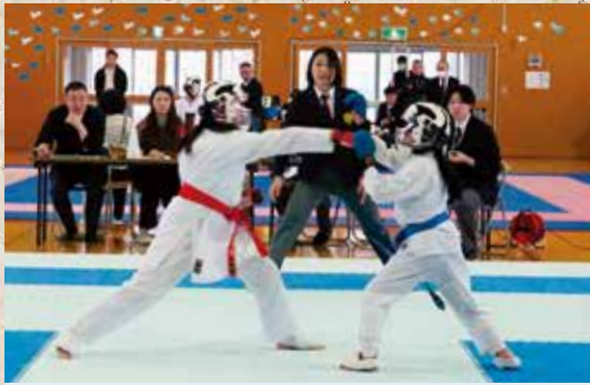
12月7日 岩内空手道親善大会