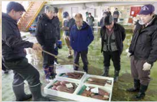
1月5日 岩内地方卸売市場初競り