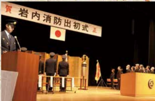
1月6日 岩内消防出初式